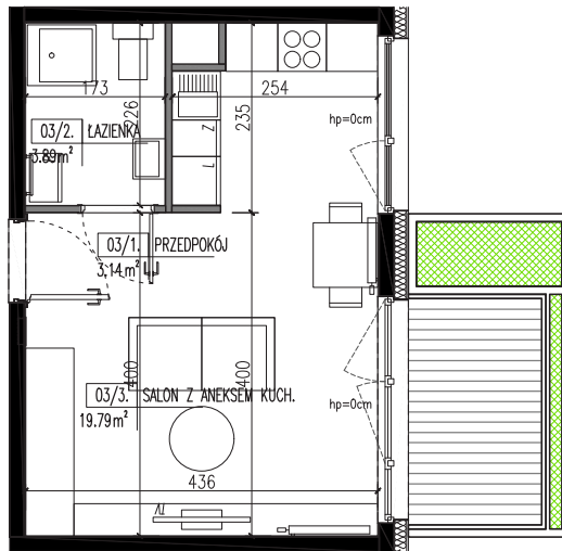
MIESZKANIE A203 - 26.82 m 2